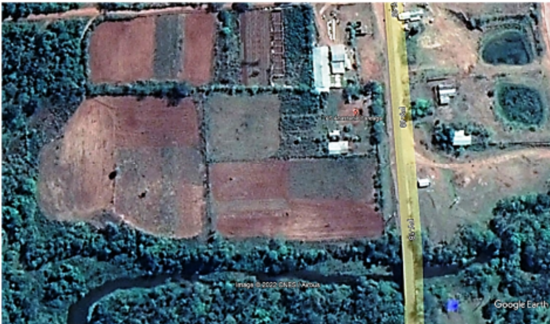
Figura N° 1: Área de Influencia del proyecto.

En la imagen satelital que se observa más abajo se indica la ubicación y los detalles del área de influencia de los yacimientos de suelo.