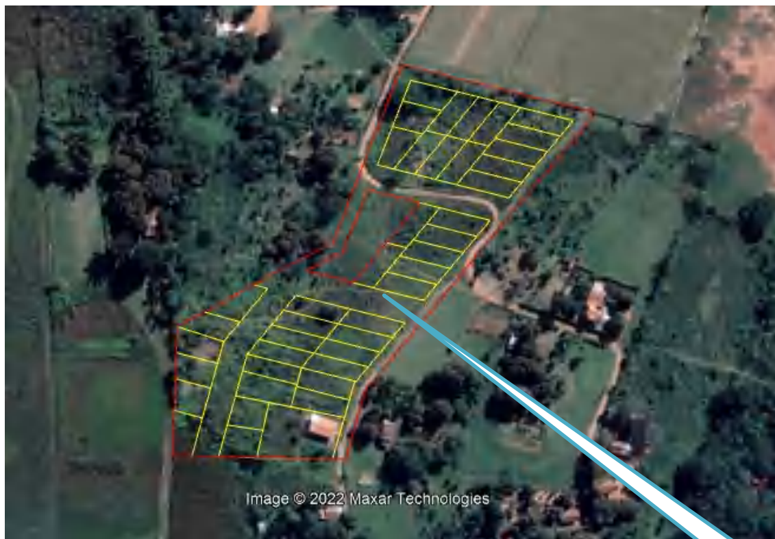
Figura: Ubicación satelital del proyecto

Coordenadas UTM: 21 J 447560 E 7179125 S