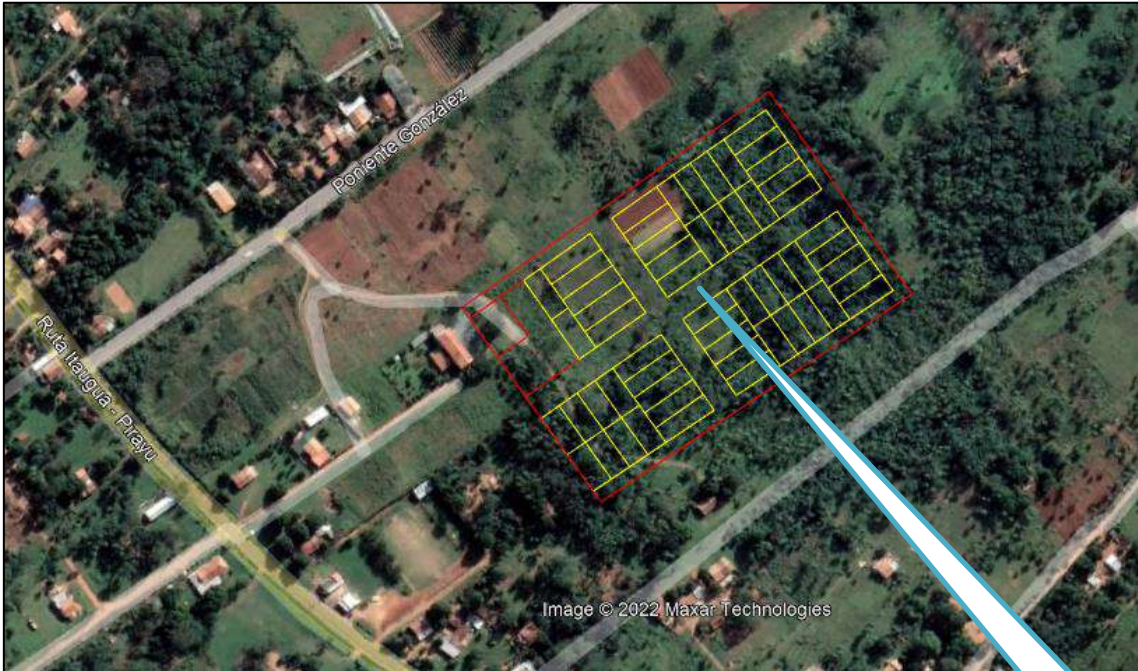
Figura: Ubicación satelital del proyecto

Coordenadas UTM: 21 J 467389 E 7187072 S