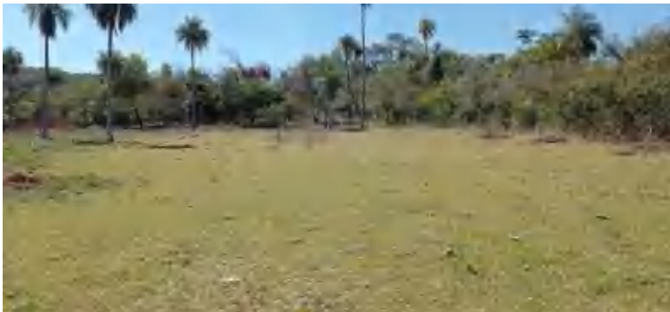
Figura N° 7: Vista de la propiedad

En este Orden, se incorporan los suelos considerados "recientes", porque el tiempo en que los factores formadores han actuado ha sido corto y los suelos no poseen horizontes genéticos naturales o sólo presentan un comienzo de horizontes, de débil expresión. Los Entisoles pueden consistir de sedimentos aluviales muy recientes o tener roca firme a escasa profundidad; pueden tener diversos colores, como los grises, amarillos pardos y rojos. Algunos Entisoles son profundos, arenosos y arenosos francos, que presentan solamente un horizonte ócrico y pueden tener un horizonte álbico, de lavado, inmediatamente debajo. En la Región Oriental del país, se los ha reconocido en todos los Departamentos, en paisajes de valles y llanuras, lomadas y serranías; se desarrollan de materiales sedimentarios, rocas de areniscas, basalto y granito, en relieve plano a fuertemente ondulado.