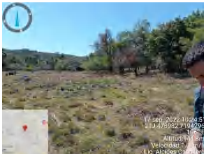
Figura N° 5: Vista general de la propiedad