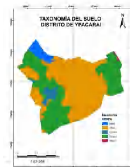
Figura N° 2: Mapa taxonómico del distrito de Ypacarai