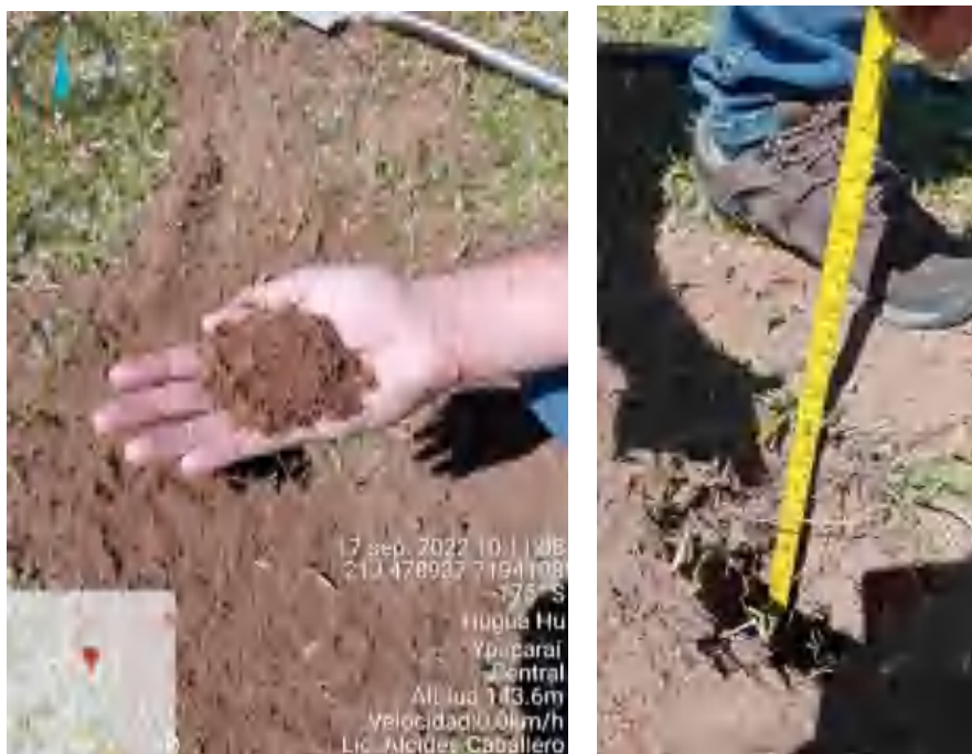
Figura N° 3: Muestra de suelo

Suelo color marrón claro, friable, sin presencia de raíces, no pegajosa, textura al tacto arenosa-arcillosa, no plástica. No se visualizó roca madre ni agua en los 80 cm de perfil. La clasificación a la cual pertenece es Entisol.