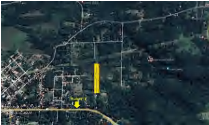
Figura N°1: Ubicación del área de estudio

El lugar propuesto para el proyecto de Loteamiento se encuentra ubicado en el Departamento Central , Distrito de Ypacaraí , en el sitio denominado Jhugua Jhu , con coordenadas de referencia igual a N= 7194355 -E= 479081. Se puede acceder a la misma a través de la Ruta PY02- Ver Figura 1.