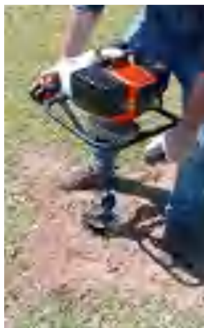
Figura N° 4: Muestreo con barreno

El Lithic Udipsamment se encuentra asociado con el Typic Paleudalf (E3/A13.3), presentándose esta unidad cartográfica en lomadas derivadas de arenisca, en fases de relieve suavemente ondulado a ondulado, con buen drenaje y sin rocas expuestas. En el Dpto. de las Cordilleras, la asociación (los suelos Lithic Udipsamrnt con Typic Quartzipsamment (E3/E2).