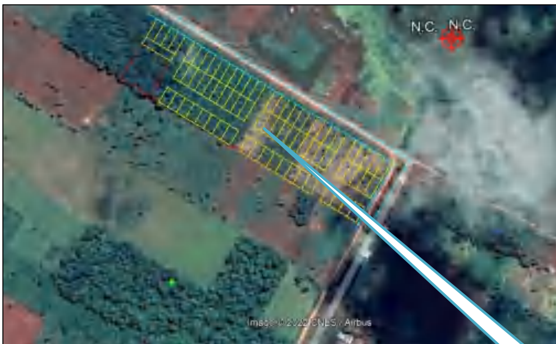
Figura: Ubicación satelital del proyecto

Coordenadas UTM: 21 J 571999 E 7344000 S