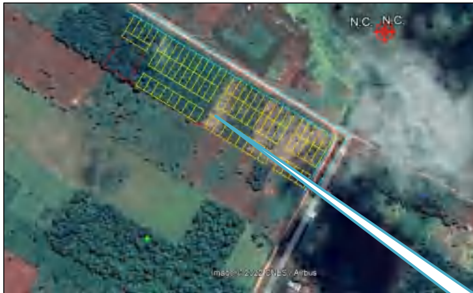
Área de Influencia Directa

La misma corresponde al área en donde se desarrolla el proyecto, se considera que la misma se encuentra en un lugar estratégico para dicha actividad, el inmueble cuenta con una superficie de 40.000 m 2 .