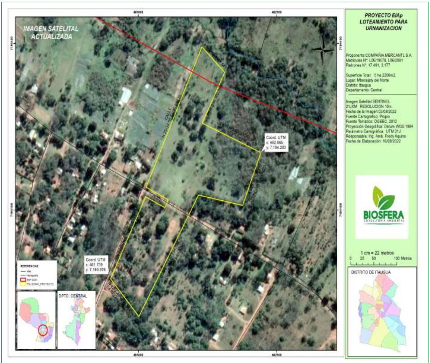
Imagen N° 3: Imagen Satelital Actualizada.