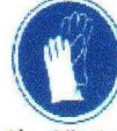
Protección obligatoria de las manos