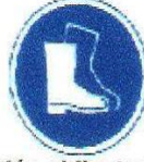
Protección obligatoria de los pies