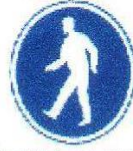
Vía obligatoria para peatones