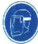
Protección obligatoria de la cara