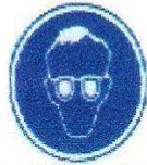
Protección obligatoria de la vista