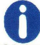
Obligación general (acompañada, si procede, de una señal adicional)