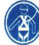
Protección individual obligatoria contra caídas