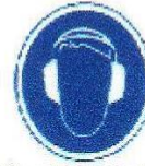
Protección obligatoria del oído