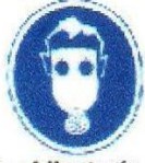
Protección obligatoria de las vías respiratorias