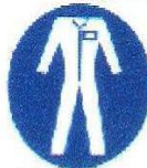
Protección obligatoria del cuerpo