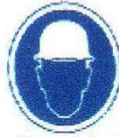
Protección obligatoria de la cabeza