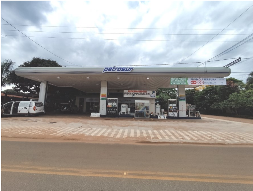
Fotografía 1. Vista del emprendimiento

Estación de Servicio con expendio de GLP y minimercado.