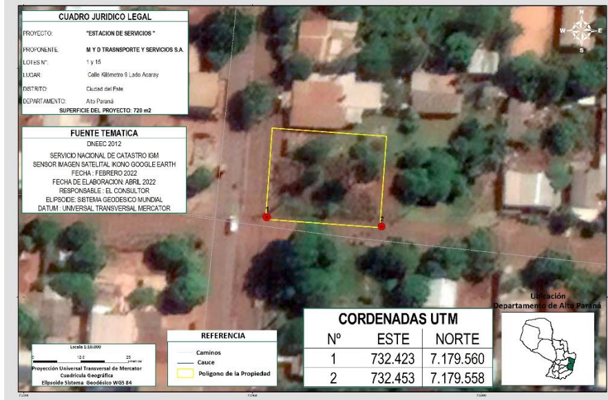
IMAGEN SATELITAL ACTUALIZADA