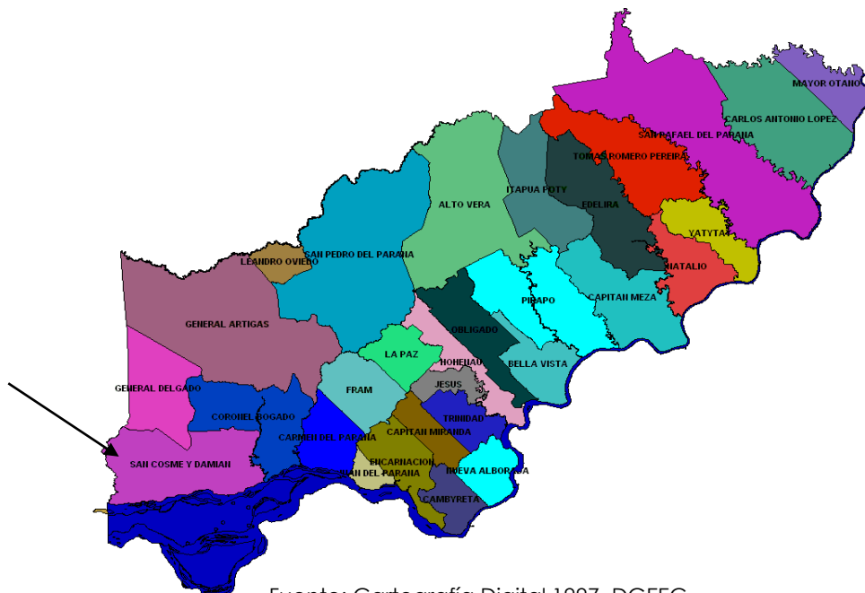
Figura 1. Ubicación de Gral. Delgado, en el departamento.