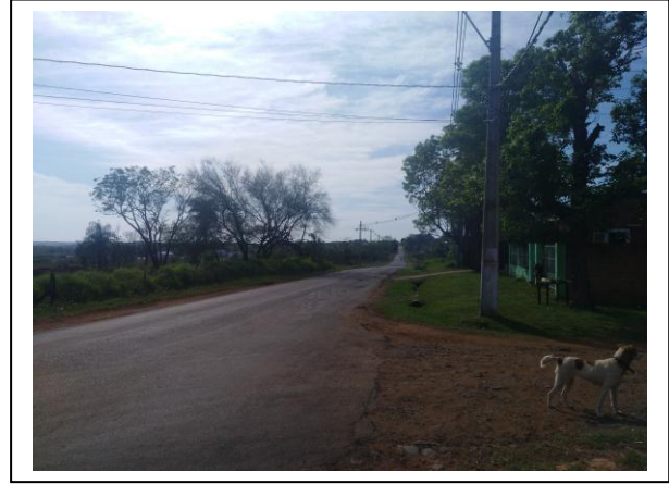
VISTA DEL ENTORNO DE LA PROPIEDAD