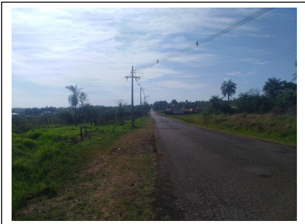
VISTA DEL ENTORNO DE LA PROPIEDAD