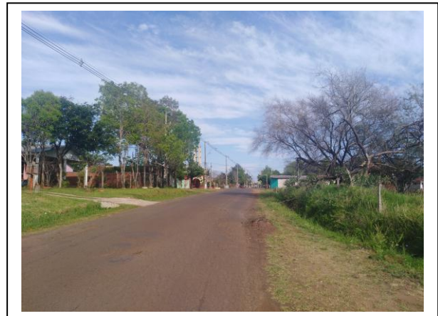
VISTA DEL ENTORNO DE LA PROPIEDAD