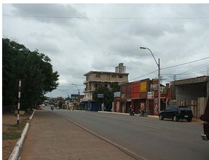
Ruta PY02 en Coronel Oviedo.

Como la ciudad es el nudo de comunicación terrestre en la región oriental, posee el Aeropuerto de Coronel Oviedo que contribuye a la pujanza comercial y de servicio de la zona, con capacidad de llegada de aeronaves de menor porte. La IATA le otorgó el código aeroportuario de COV y la OACI el Código Aeronáutico de SGOV.