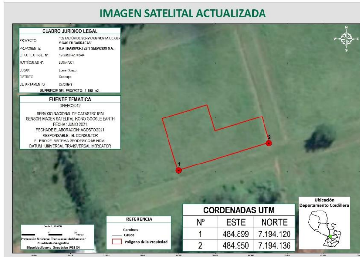
IMAGEN SATELITAL ACTUALIZADA