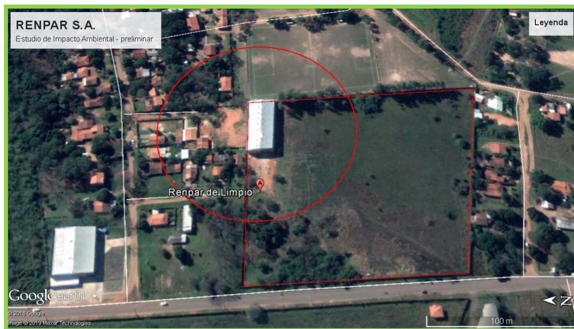
Imagen 1. Área de influencia directa e indirecta del proyecto