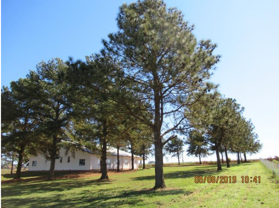
Área verde del predio