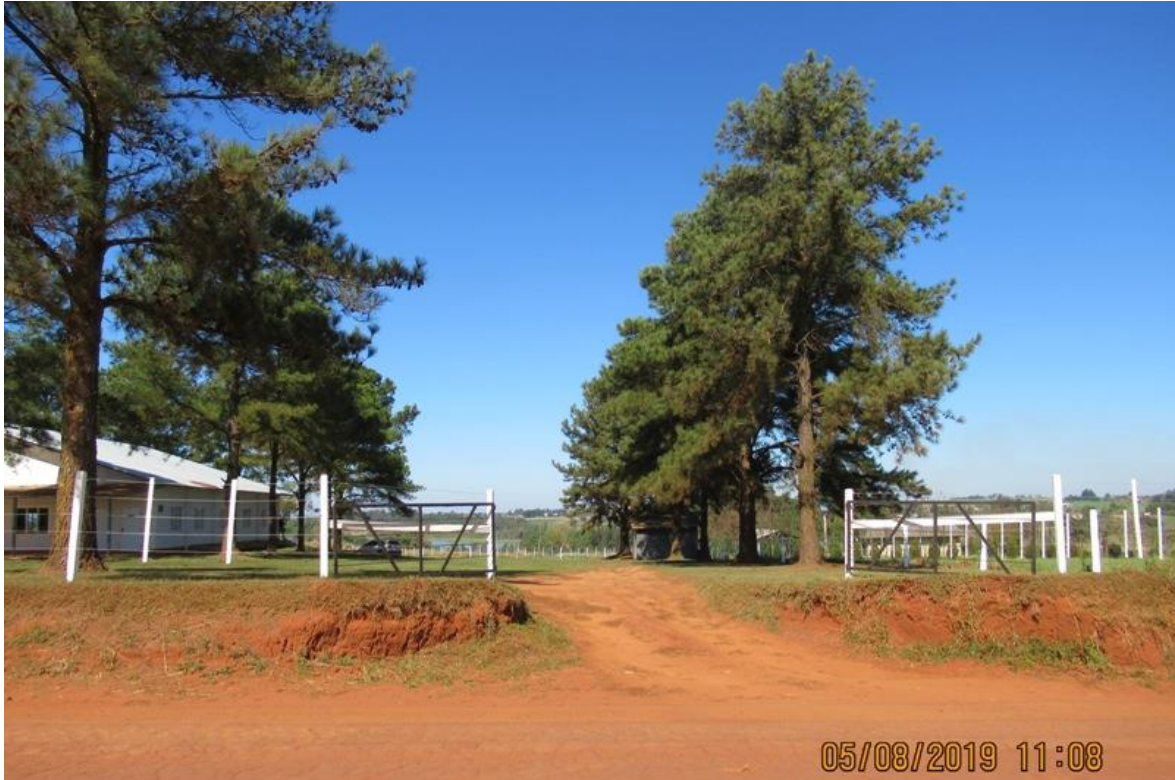
Portón de entrada

Coordenada de ubicación: X= 642881 m E Y= 7199718 m S