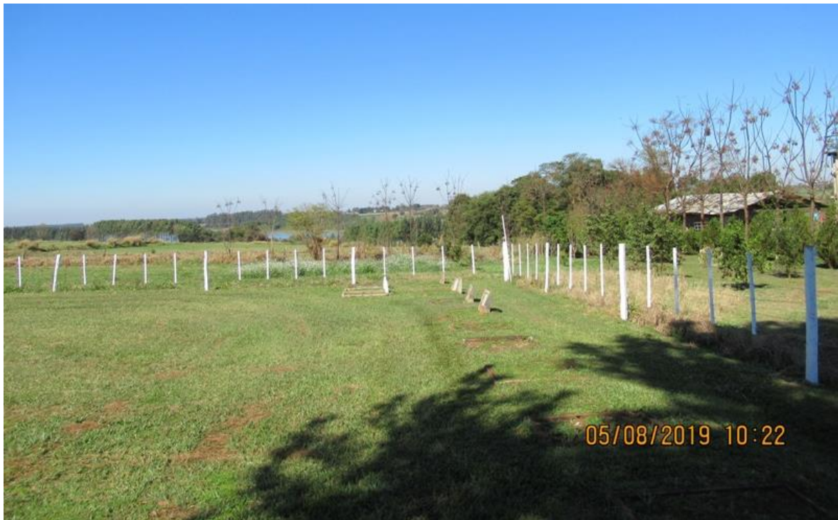
Área de tumbas - sepulturas bajo tierra