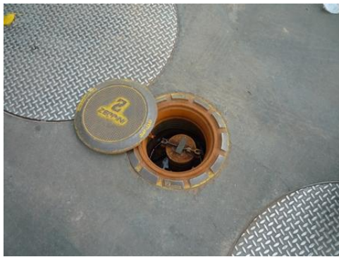
TANQUE DE DESCARGA DE COMBUSTIBLES