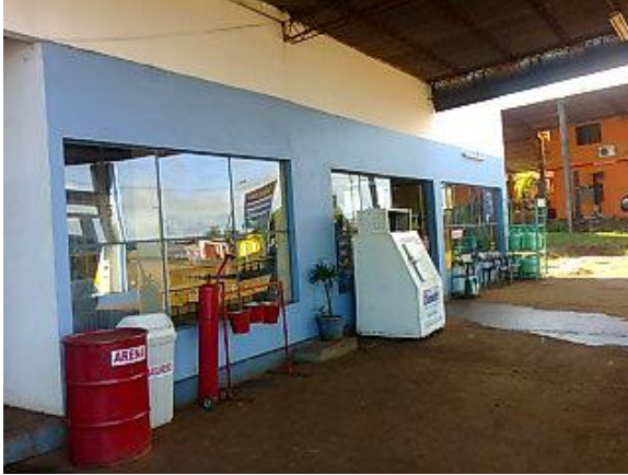
ZONA DE EXPENDIO, EXTINTOR, BALDE DE ARENA Y CARTELES DE SEÑALIZACION.