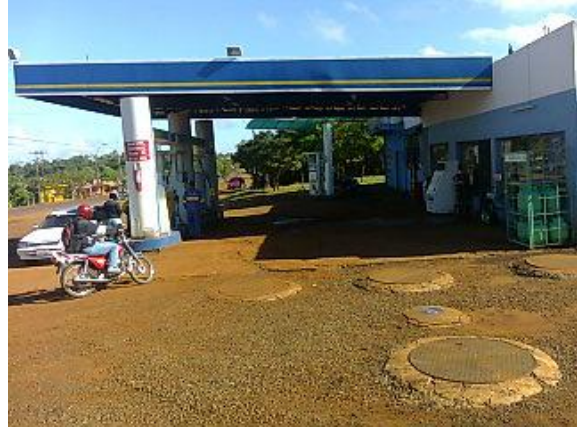
ZONA DE EXPENDIO CON IMPERMEABILIZACIÓN DE SUELO