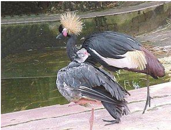
Aves de Alto Paraguay.

La zona de Fuerte Olimpo es la más prodigiosa de la región, de la llamada “Pantanal Paraguayo”.