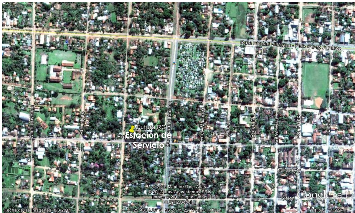
Figura 2. Imagen satelital del área del emprendimiento.