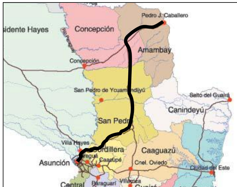
Figura 3. Área de Influencia indirecta.