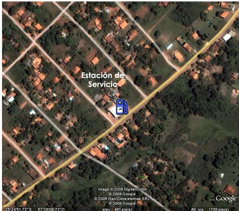
Figura 2: Ubicación del emprendimiento.