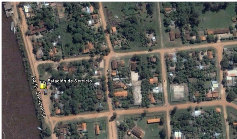
Figura 2: Ubicación del emprendimiento.