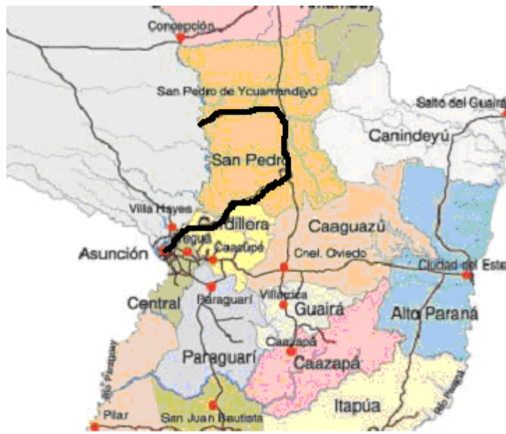
Figura 3. Área de Influencia indirecta.