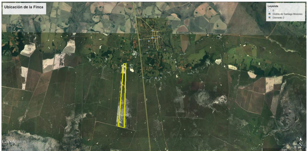
Figura 2: Croquis de ubicación y acceso.

Las propiedades en estudio se encuentran ubicadas en el Distrito de Santiago, Departamento de Misiones.