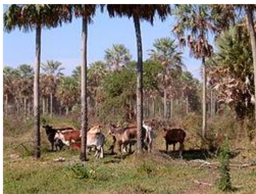
Ganado en las sabanas del Bajo Chaco.

La actividad más importante es la ganadería, extensiva en las sabanas del Bajo Chaco en el este del Departamento, intensiva en las pasturas para engorde, implantadas en las suelos más fértiles de tierras anteriormente desmontadas. Allá los ganaderos logran una dotación de 2 UG/ha con pastos de las variedades Gatton Panic, Tanzania, Colonial etc.