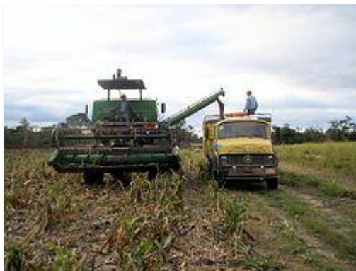
Cosecha de sorgo 2008, Línea 14, Agua Dulce, Alto Paraguay.

La actividad más importante es la ganadería, extensiva en las sabanas del Bajo Chaco en el este del Departamento, intensiva en las pasturas para engorde, implantadas en las suelos más fértiles de tierras anteriormente desmontadas. Allá los ganaderos logran una dotación de 2 UG/ha con pastos de las variedades Gatton Panic, Tanzania, Colonial etc.