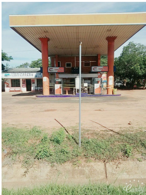
Vista frontal de la Estación de Servicios

El sector cuenta con servicios de energía eléctrica, telefonía, ruta asfaltada, calles terraplenadas y no cuenta con servicio de recolección de basura y tampoco con desagüe cloacal.