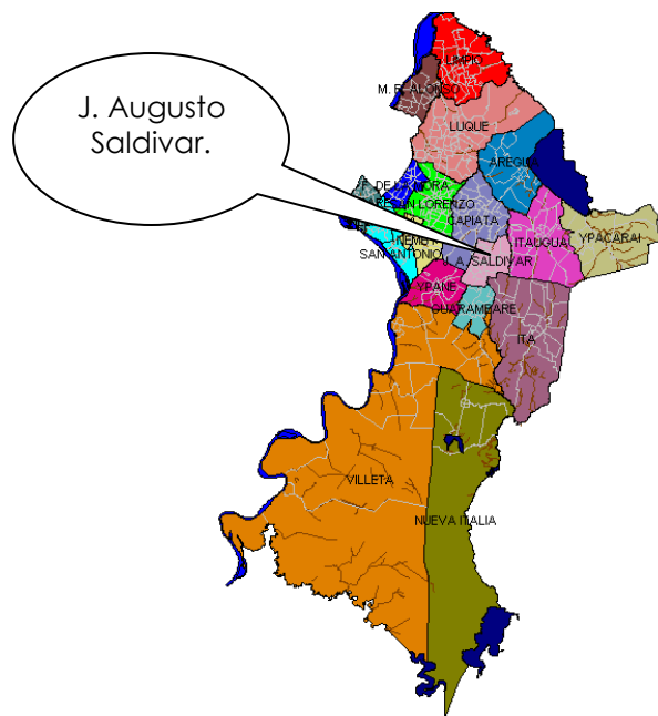
Figura 1. Ubicación del emprendimiento, Departamento de Central con sus Distritos.