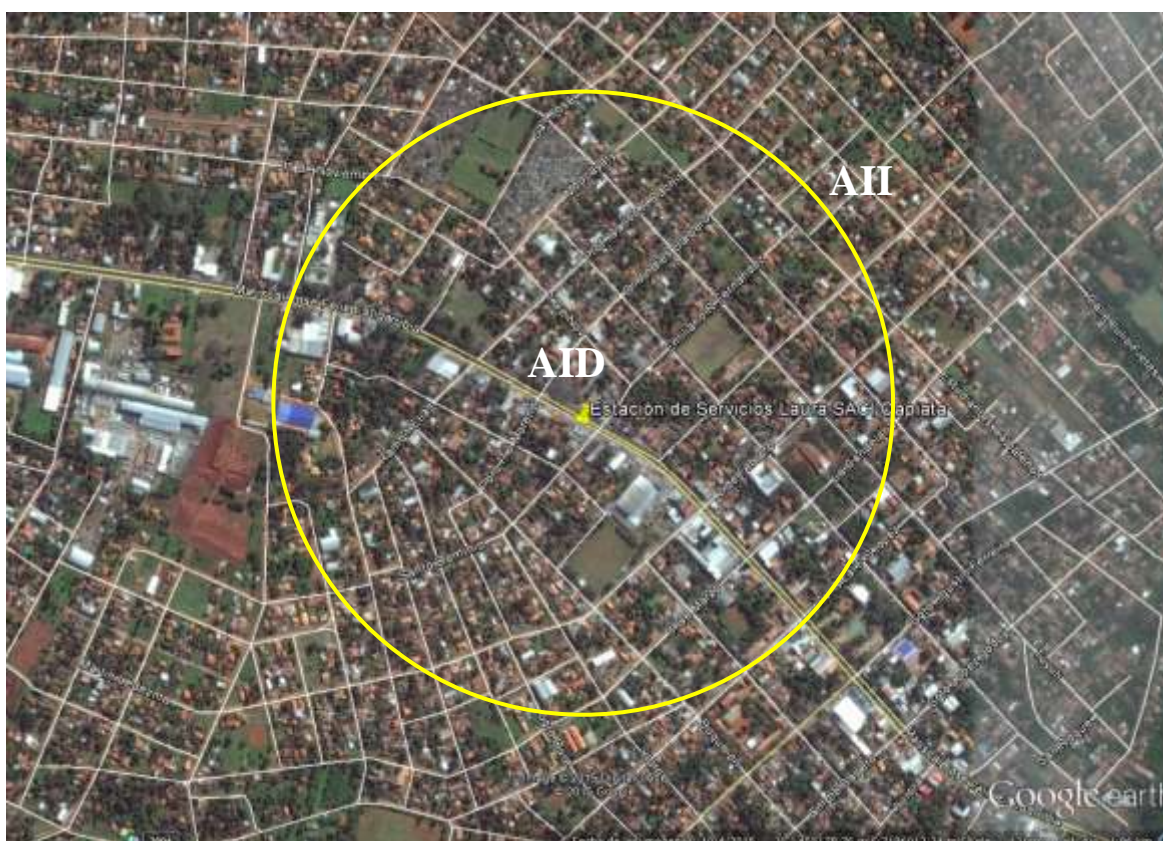
Imagen 1: Área de Influencia del Proyecto

La zona de referencia es urbana y se observa la existencia de numerosas industrias, viviendas, comercios, servicios y otros en las cercanías del Proyecto.