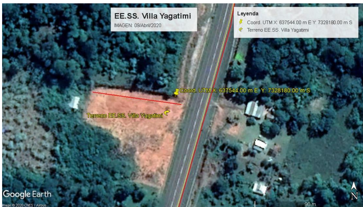
Imagen 2. Ubicación del proyecto

El área del emprendimiento se ubica a 2 km de Villa Ygatimi sobre la Ruta PY013, como se puede observar en la siguiente imagen.